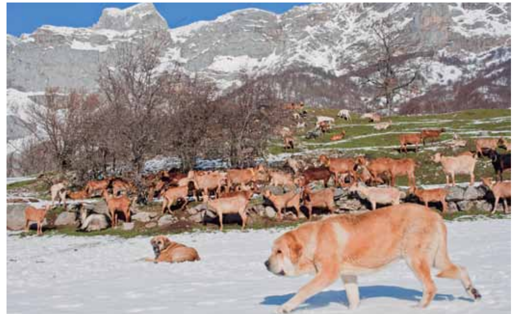
Picos de Europa, por sus fuertes desniveles, es una de las áreas más exigentes para el trabajo de los mastines.

Durante mucho tiempo, debido a su misma función, defender los rebaños del lobo, y a su gran tamaño corporal, a los mastines de estas