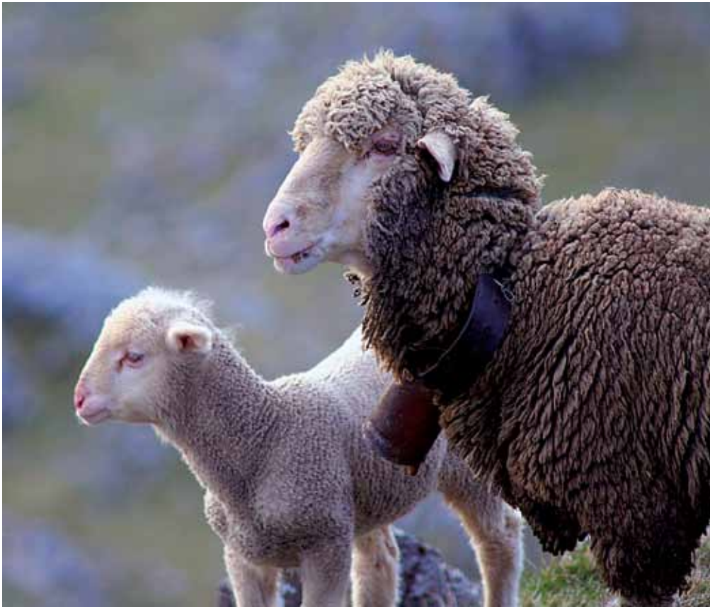
La oveja merina inseparable compañera del Mastín Español.

Mastines con prognatismo o enognatismo real no deben ser utilizados en la cría, ya que tienen un componente hereditario importante. La presencia de prognatismo puede tener dos problemas: la reducción de la dentición y/o que impacten los dientes en zonas blandas, incluido el paladar. Además, muchos perros con prognatismo inferior tienden a tener un cráneo más corto (braquicefalia).